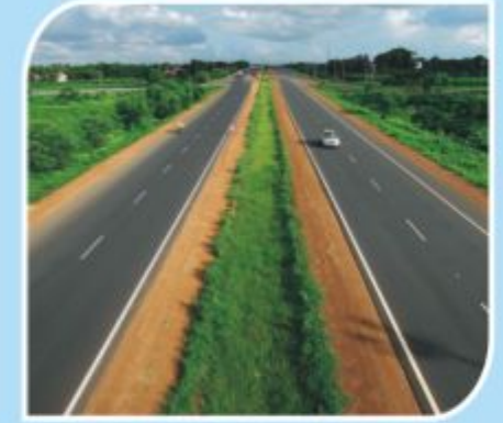
चाकण सोलापुर रिंगरोड