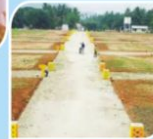
प्लॉट अंतर्गत १८ फुटी पक्के रस्ते