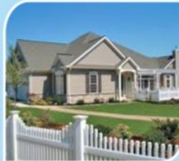
प्लॉटला लागुन लोकवस्ती